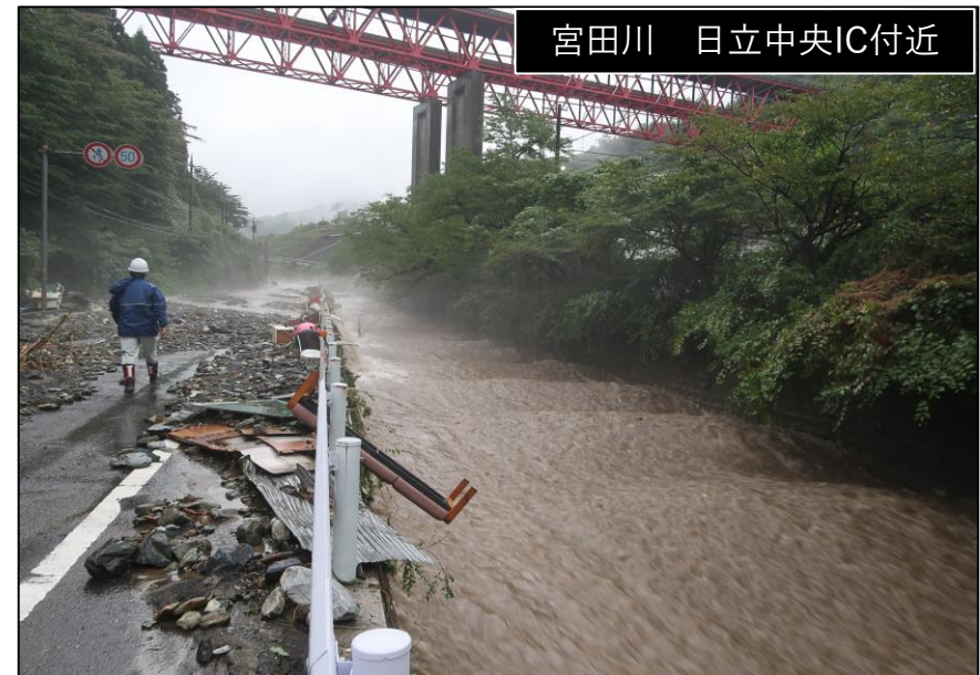
宮田川 日立中央IC付近