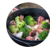
～タコとブロッコリーのアヒージョ～