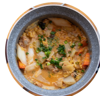
～あんこうのどぶ汁～

水を使わず、あんこうと野菜から出る水分だけで煮込む「どぶ汁」はコクがあり、鶏喜鶏喜“特製味噌”との相性もバッチリ！