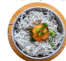
～しらすのせ卵かけご飯～