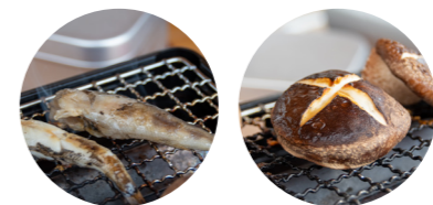
～メヒカリとしいたけの網焼き～

水を使わず、あんこうと野菜から出る水分だけで煮込む「どぶ汁」はコクがあり、鶏喜鶏喜“特製味噌”との相性もバッチリ！