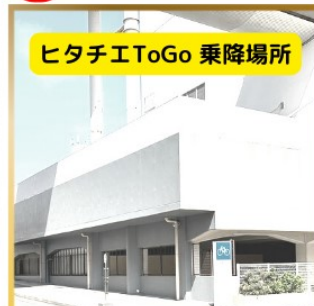
ヒタチエToGo 乗降場所