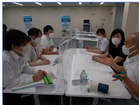
[令和2年度初任者研修会の様子]