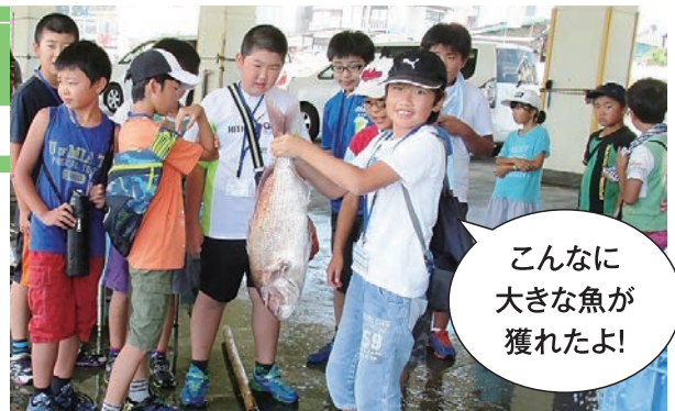
好奇心の芽を育てる職業探検少年団

みんなで学び、共に教え合いながら、市民の誰もが生涯にわたって生き生きと過ごすことができる生涯学習を推進します。