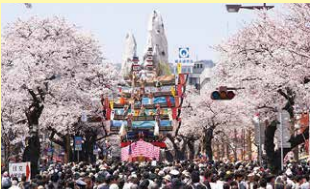
ユネスコ無形文化遺産の日立風流物