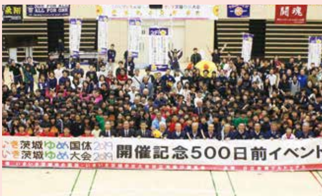
スポーツの拠点 池の川さくらアリーナ