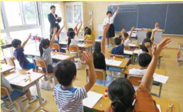
安全・安心で快適な学校