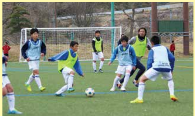
人工芝でいつでもベスト・コンディション！