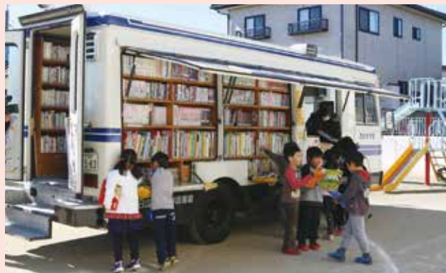
移動図書館で本が身近に!