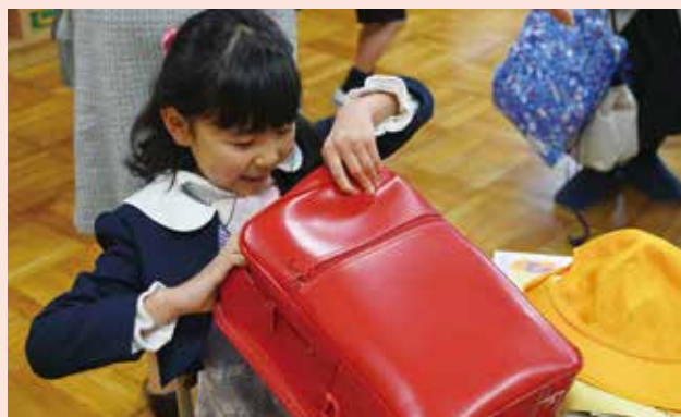
入学おめでとう! (ランドセル・スクールカバンの贈呈)