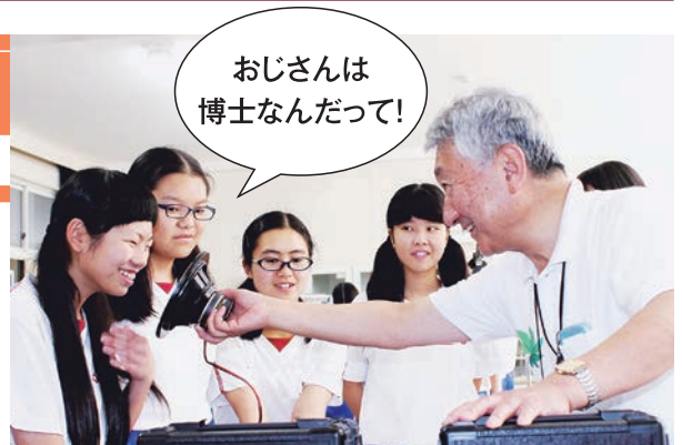
「理科室のおじさん」が授業をお手伝い

子どもたちが「自分のよさ」に気付き、自己肯定感・自己有用感を高め、お互いのいいところを見出し、認め合いながら、未来への夢を描くことができる学校教育を推進します。