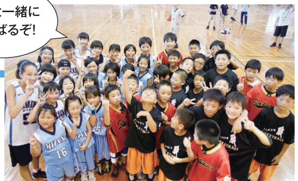
スポーツ少年団の数は県内一