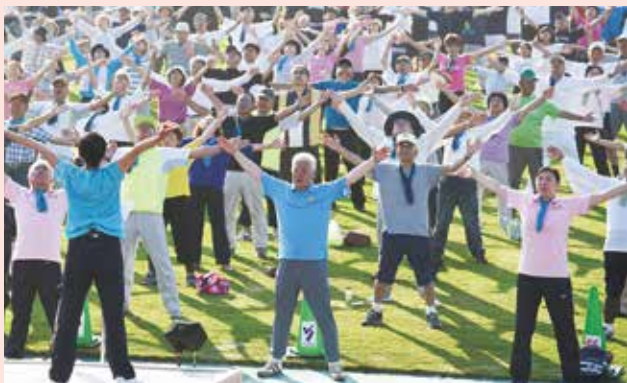
“ひたち発”のラジオ体操