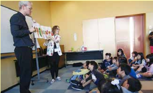
外国語指導助手（ALT）による英語教室