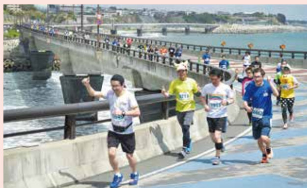
絶景を駆ける「さくらロードレース」