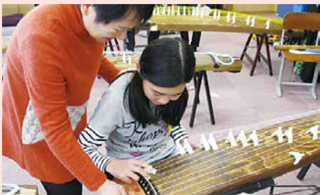
地域ぐるみで子どもを育成