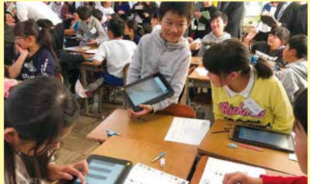
タブレットで分かりやすい授業