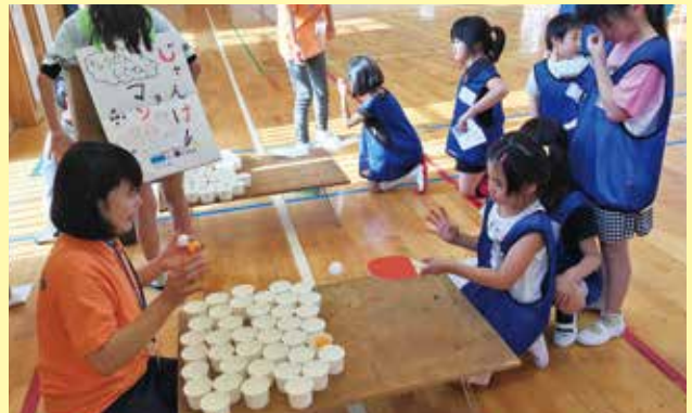
放課後もみんなと一緒に！（放課後子ども教室）