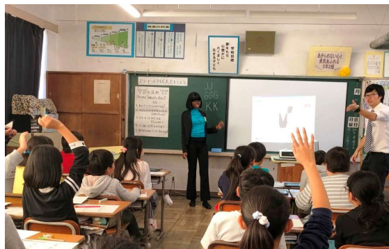
外国語指導助手による授業の様子