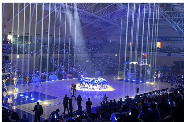
池の川さくらアリーナで行われた 茨城ロボットの試合