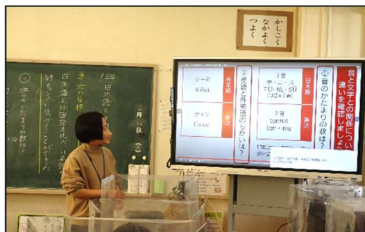
電子黒板を使用した授業（成沢小学校）