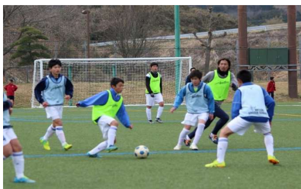
人工芝でベスト・コンディション！（折笠スポーツ広場）