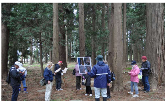
長者山遺跡ガイドツアー