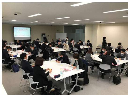
学校運営協議会委員やコミュニティ関係者を対象とした地域学校協働活動研修会