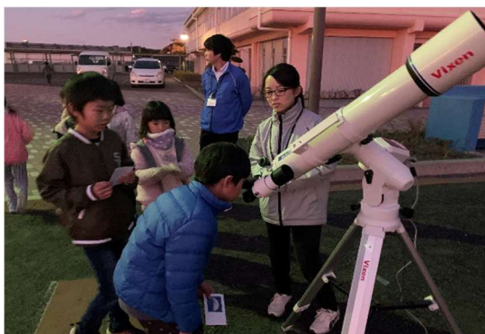
放課後こども教室で開催した スターウォッチング