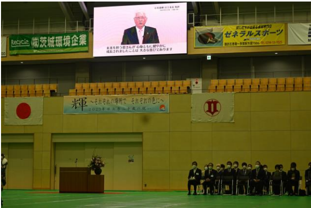
祝辞（市長のビデオメッセージ）