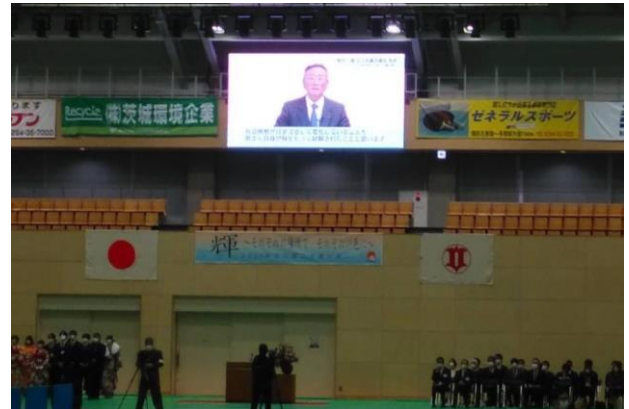
祝辞（議長のビデオメッセージ）