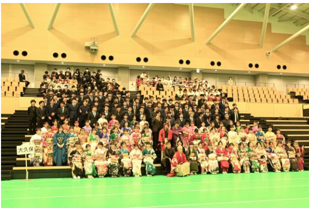
出身中学校ごとの記念撮影