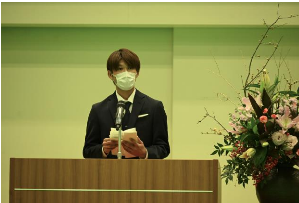
式辞（実行委員長の挨拶）