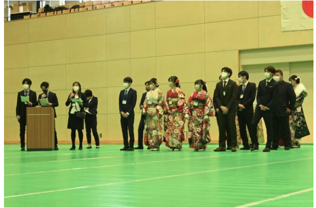
式典を運営する実行委員