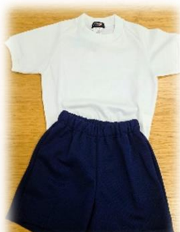
山部小・櫛形小で現在使用している体操服