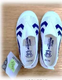
MOONSTAR バイオTEFO1 ブルー