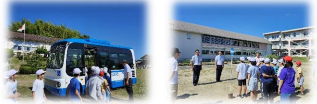
山部小で実施したバスの乗り方教室の様子(9/30)

統合により通学距離が延伸する子童に対して、市では路線バスを活用した通学支援を検討しています。現在、山部小学校の学区を運行している椎名観光バスに御協力いただき、統合後の通学支援について調整を進めています。