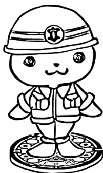
下水道PRキャラクター 『アザまる』