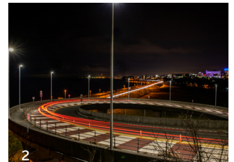
1. S字に沿って車の光跡が鮮やかな「日立シーサイドロード」と、2.「浜の宮らせん橋」の夜景。走行する車の放つ光により、夜は昼間とは違った表情を見せてくれます。