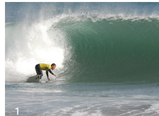
1. 波に乗るサーファー。県内外を問わず、多くのサーファーが「良い波」を求めて河原子海岸を訪れます。

また、河原子海岸には「 えぼしいわ 烏帽子岩」があります。もともとは地続きの台地でしたが、波の浸食により削られ、現在の姿になりました。かつては岩の一部が海に隠れていましたが、1985（昭和60）年頃の港湾建設の際に埋め立てられ、海浜公園として整備されました。烏帽子岩には、津神社が祀られ、中腹には「藤田東湖」の詩碑が建てられています。