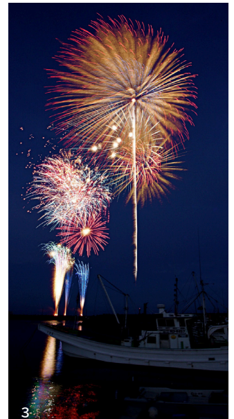
3. 海上に打ちあがる花火。夜空を鮮やかに彩る「ひたち河原子花火大会」は日立市の夏の風物詩です。