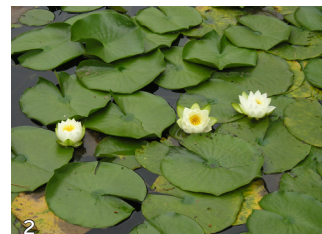
1・2. 公園の中心部に位置する「中央池」。夏は清々しいスイレンの花を楽しむことができます。また、水辺には水鳥が羽を休めにくるため、バードウォッチングにおすすめのスポットです。