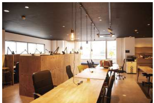
2. 上・下／『Coffee Stand GENKAN by Tadama Coffee』(p.5)の2階にある、『HUB Square HITACHI』。