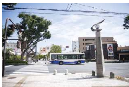
新しい動きが始まりつつあるという日立市。