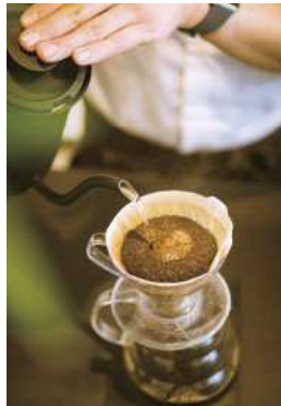
右・左上／日立駅から約徒歩5分のところにある「Coffee Stand GENKAN by Tadaima Coffee」。左下／住宅街にある「Tadaima Coffee」。