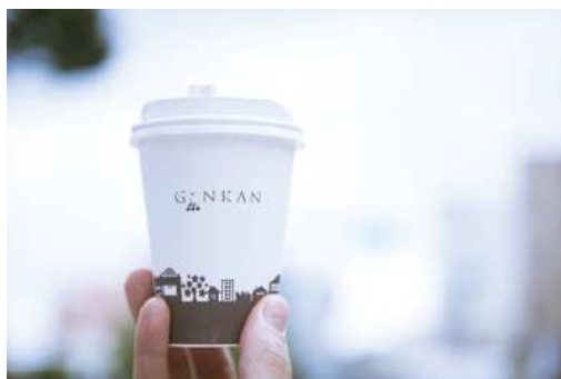
日立のさまざまな風景がデザインされたカップ。

新しい日立を感じるには、まずどこへ行けばいいか。たとえば日立駅から徒歩5分ほどのところにある『COFFEE