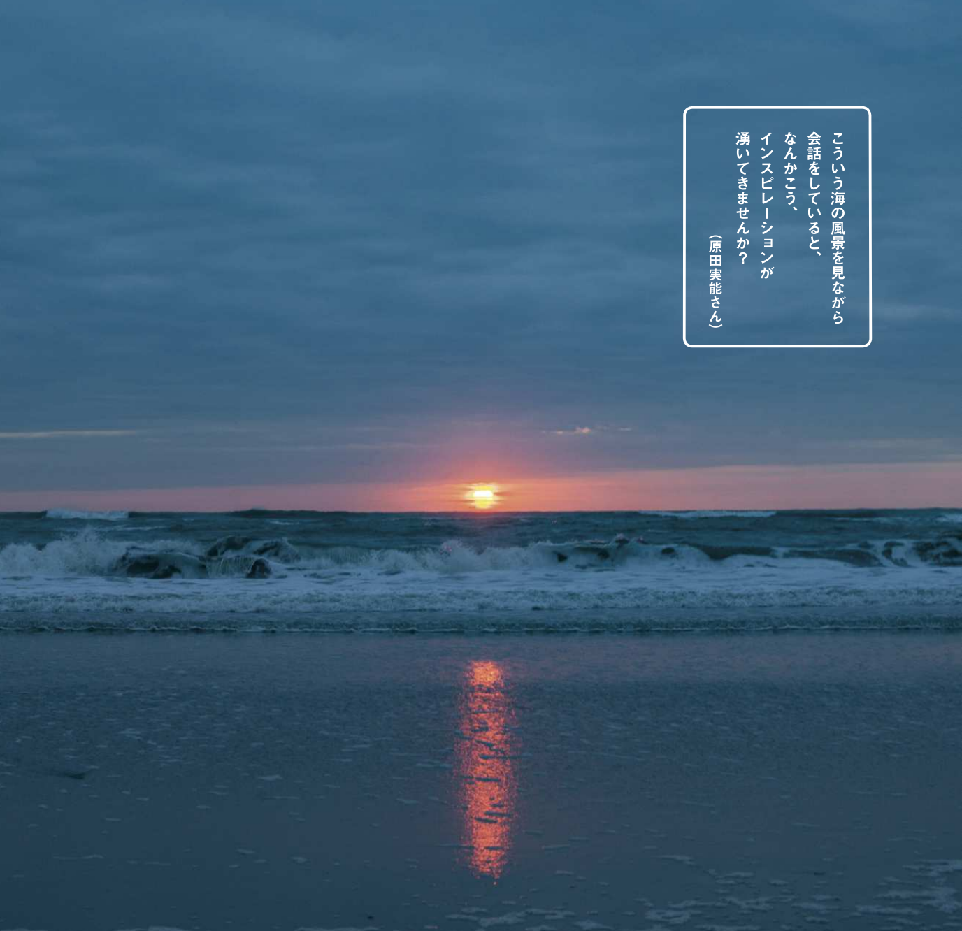
海面に映る陽の光も美しい、久慈浜海水浴場で撮影した朝日。