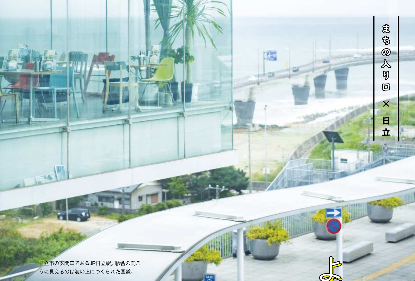
日立市の玄関口であるJR日立駅。駅舎の向こうに見えるのは海の上につくられた国道。