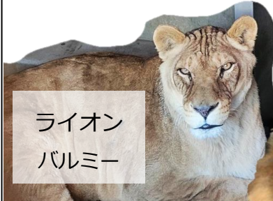
ライオン バルミー