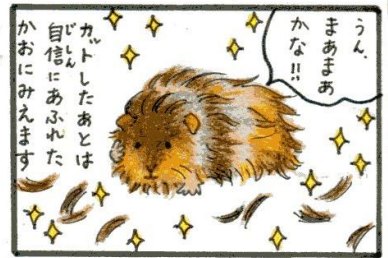
長毛種のモルモットは、毛先を引くくらいひたす時はカットすることも。夏場は暑さ対策にもなります!