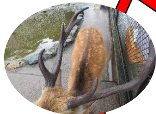
8月下旬、角が固くなり、ゴツゴツする