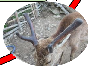
5月下旬、ぐんぐん成長