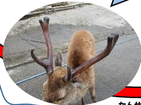
6月下旬、2回目の枝分かれ