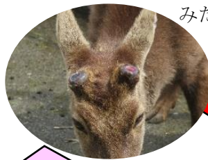
3月下旬、角が抜け落ちる