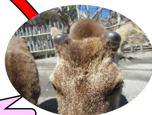
4月上旬、少し生える