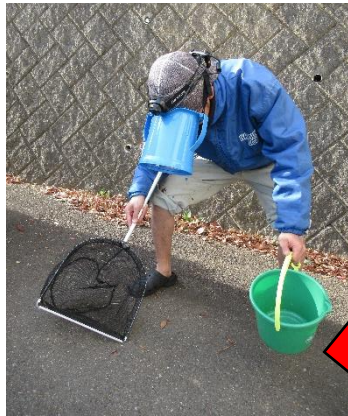
(ぼくらのうみ調査隊の装備)

いつも夜の海で魚を捕まえています。夜だと浅い場所に魚が寄るし、魚の動きが鈍くなっているからです。季節毎にいる魚が全く違うので、冬の海にも突撃します！寒いけどそこはがまん！耐え抜いた先には毎回新たな発見・出会いが待っているのです。合言葉はみんなの笑顔のために！ただし、夜の海は危険も多いので、安全装備を整えて、必ず2人以上で行動します。もちろん明るい時でも魚は捕まえられるので、海に遊びに行ったときは生き物を探してみてくださいね！