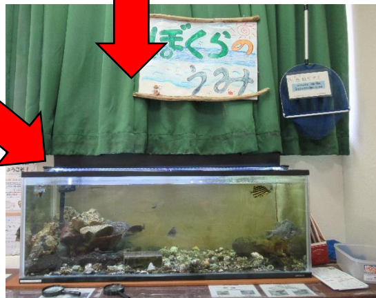
(ぼくらのうみどうぶつ資料館)