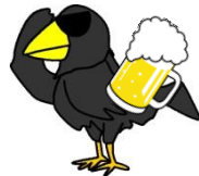
ビール科エンチョウガラス