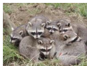
アライグマダンゴ?

※1 かみね動物園、※2 那須どうぶつ王国、※3 上野動物園、 ※4 アクアワールド大洗、※5 アクアマリンふくしま ※6 茶臼山動物園、※7 井の頭自然文化園で会えます。