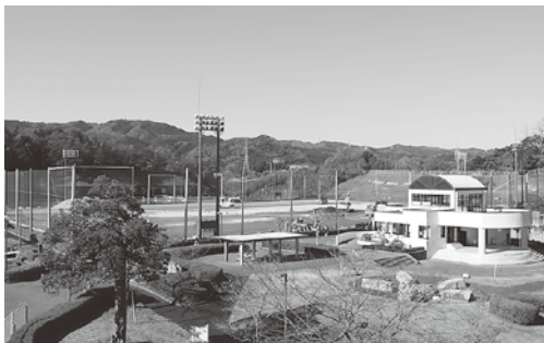
人工芝生の整備が進む折笠スポーツ広場(折笠町)

▼平成28年度一般会計補正予算《国の補助採択により工事を前倒しして実施する諏訪小学校校舎の解体、久慈小学校校舎の解体及び改築、宮田、滑川、塙山小学校3校と多賀、泉丘中学校2校のトイレ改修費などの事業費の増額、訪問看護事業所が行う在宅診療等で使用する訪問用自動車の購入に対する補助の計上など》