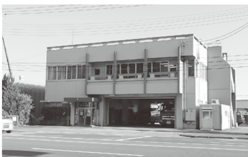
施設統合により移転する臨港消防署（久慈町）

に、老朽化や耐震性などの面からも、今後の在り方について本格的に検討を進めてきた。この3施設は管轄区域が重なり合っていることから1ヶ所に統合し、効率的で質の高い消防サービスの提供を目標に掲げて検討を重ねている。施設基準数を満たしつつ管轄区域を1ヶ所に包含できる場所の選定を始め、防火水槽、井戸の設置計画、また久慈川の氾濫等による水害を想定した対応策を充実させるために消防車両の配置を再編するなど、効率性のある消防体制の強化を目指している。 統合が広範囲にわたることから、地域住民の理解を得られるよう説明を行い、消防力の更なる充実強化に全力で取り組んでいきたい。