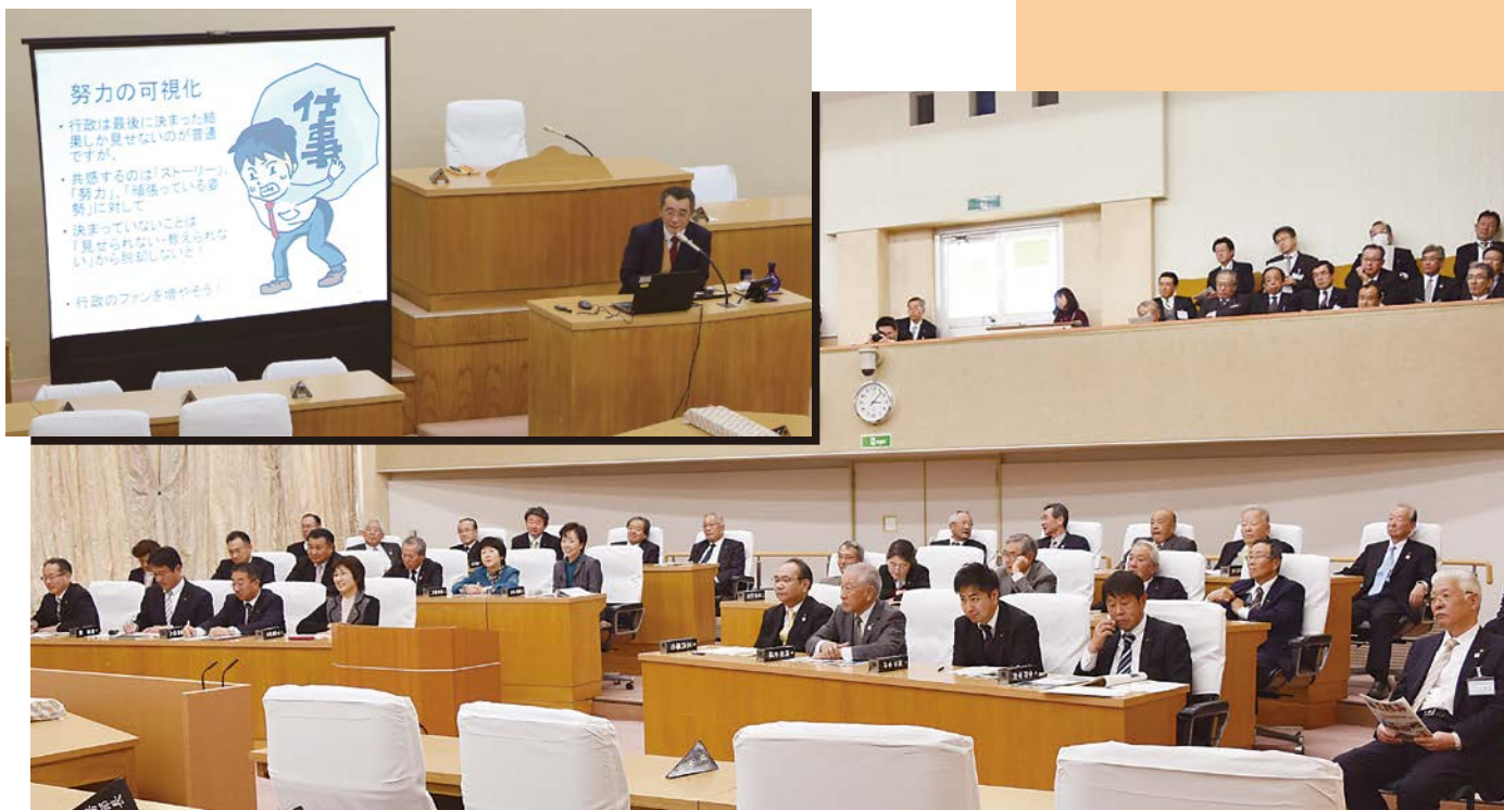
市議会議員のほか、小川市長をはじめとする市職員も熱心に聴講しました。