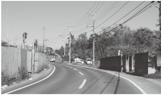
歩道の設置などが計画されている市道3号線（東滑川町）

都市建設部長 本計画は、日立バイパスから県営田尻浜アパートまでの区間で、車道拡幅や急カーブ箇所のパイパス化、併せて片側2・5メートルの歩道を設置し、全体幅員10メートルで整備するものである。この整備により、車両及び歩行者の安全な通行が確保されるとともに、国道6