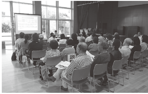
久慈川日立南交流センターで行われた安定ヨウ素剤事前配布会

また、児童生徒等の保護者への引渡しは、事故発生後放射線物質が放出する前の早い段階で開始できるように、避難計画を策定する中で、学校などの協力を得ながら検討したい。