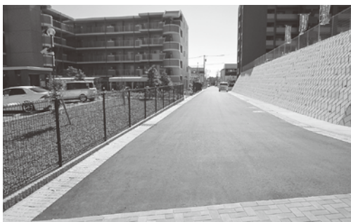
開発行為に伴って認定する路線(会瀬町)

▼平成28年度一般会計補正予算《川尻町、折笠町地内の観音前下新旗線において道路法面保護工事等を実施するための経費、及び市道7175号線改築事業に係る経費の増額、ひたちBRT沿線における土地利用の現況調査に係る事業費の増額など》