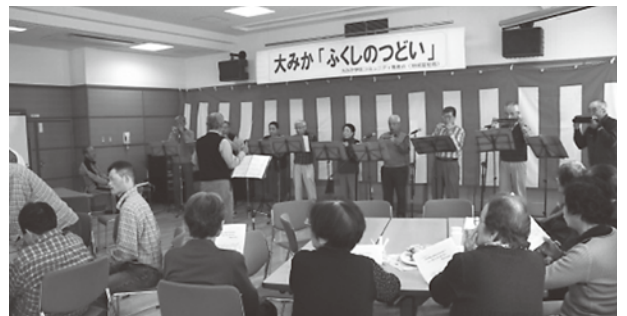
コミュニティの主催で行われる「ふくしのつどい」

生活環境部長 各種ボランティア団体やNPO法人などがコミュニティ活動に参加することは、その活性化を進める上で有効な取組の一つになる