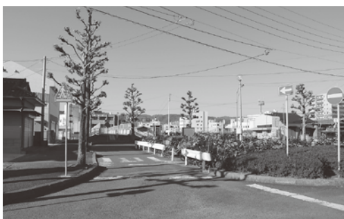
整備が望まれる常陸多賀駅東口（東多賀町）

都市建設部長 常陸多賀駅周辺においては、これまで西口広場の再整備を実施したが、東口駅前広場の未整備による市街地の分断や駅舎の老朽化など、本市人口の3分の1が居住する多賀地区の顔として十分な都市機能や魅力ある都市空間の形成がなされて