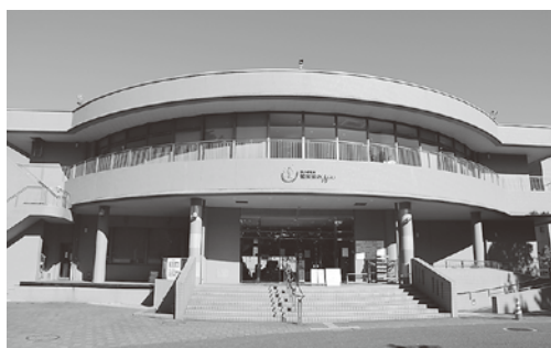
入館者300万人を達成した鶴来来の湯十王（十王町伊師）

確保するとともに、使用料の額を公募により決定することなどを定めた》 ▼ 公共施設の指定管理者の指