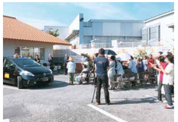
諏訪学区で実施する乗合タクシー試験運行の出発式の様子

高齢化の更なる進展などにより、公共交通の役割が一層高まりを見せる中で、ドア・ツー・ドアで移動できるタクシー活用への期待は大きくなってきている。今後、各地域における路線バスの利用環境や、乗合タクシーの試験運行の検証などを踏ま