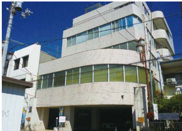
創業支援に活用される「マイクロクリエイションオフィス」(千石町)

事業を進めてほしい。また、日立創業支援ネットワークと連携して、既存の産業も結び付けた若手起業家の育成を進めるとともに、雇用の創出にもつながるような取組を展開してほしい。