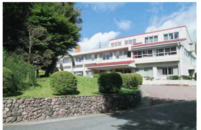
昭和57年の開設以来、地域に溶け込む大みかけやき荘

議員 知的障害者の入所施設として重要な大みかけやき荘は、利用者の高齢化などにより、解決すべき数多くの課題を抱えているが、当該施設の今後の方向性について、所見を伺いたい。