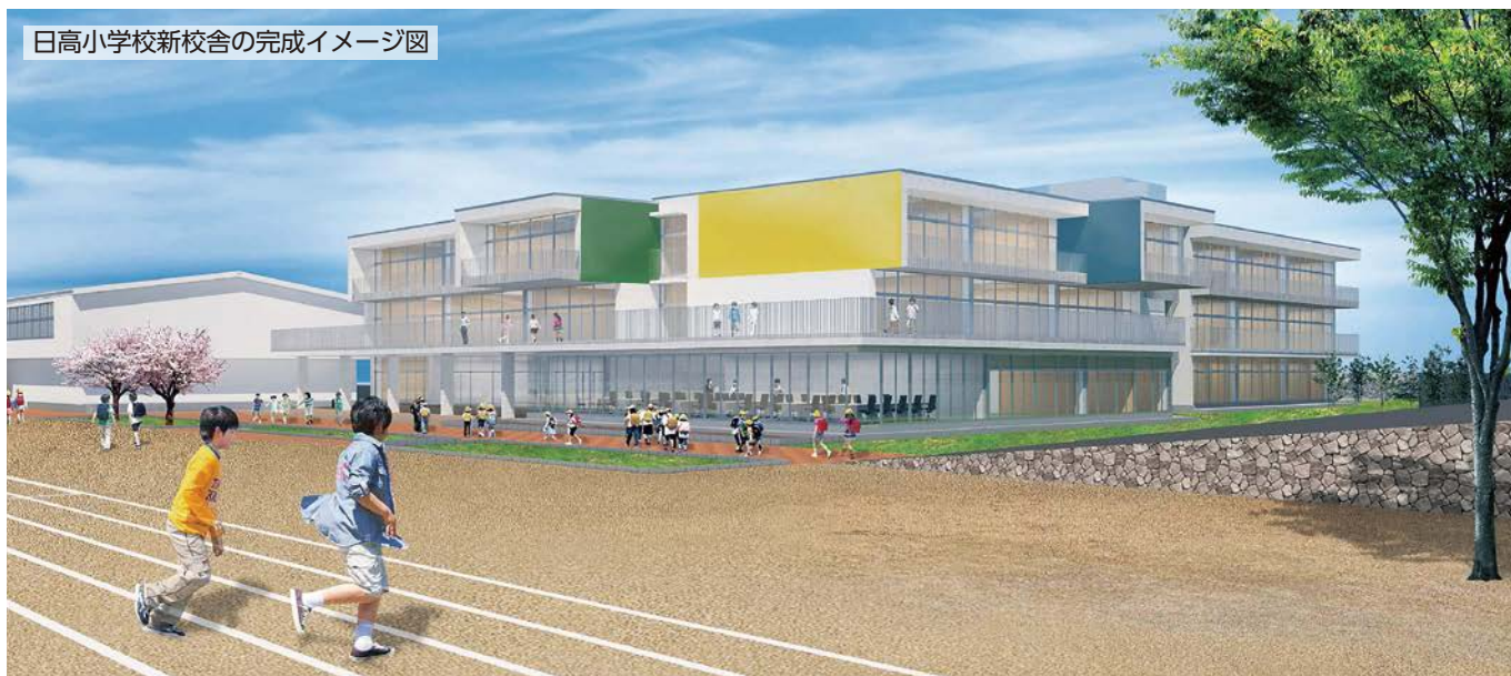
日高小学校新校舎の完成イメージ図

今期定例会において、日高小学校の校舎改築に関する議案が可決されました。 新校舎は令和2年度内に、グラウンドなどは令和3年度内に、工事が完了する予定です。 9月14日に行われた旧校舎での最後の運動会は、約50年にわたって児童を守り、育ててくれた旧校舎との思い出として参加者の心に刻まれました。