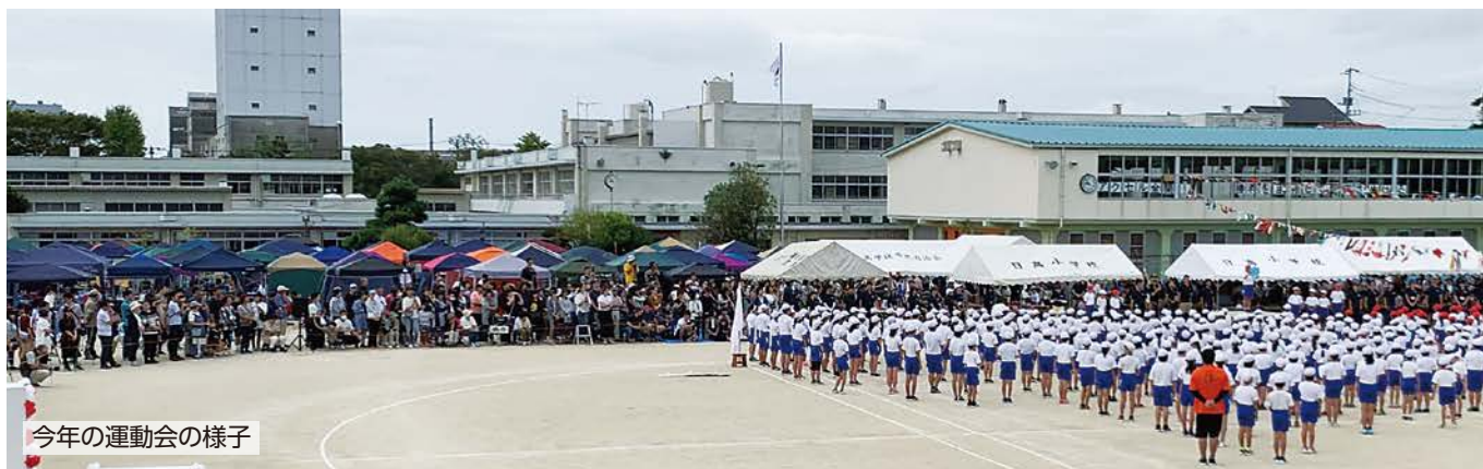
今年の運動会の様子

今期定例会において、日高小学校の校舎改築に関する議案が可決されました。 新校舎は令和2年度内に、グラウンドなどは令和3年度内に、工事が完了する予定です。 9月14日に行われた旧校舎での最後の運動会は、約50年にわたって児童を守り、育ててくれた旧校舎との思い出として参加者の心に刻まれました。