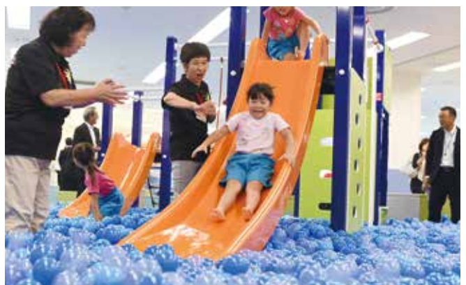
屋内型子どもの遊び場「Hiタッチらんど・ハレニコ！」はイトーヨーカドー4階です

産業経済部長 NPO法人「子ども大学常陸」は、子育てや人材育成などにつながる活動を一貫して実施