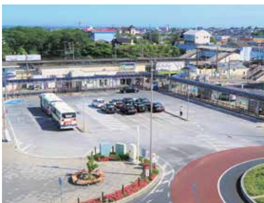
官民連携による新たなまちづくりが期待されている常陸多賀駅周辺地区

都市建設部長 駅周辺を都市の拠点とし、商業や医療、福祉などの都市機能の維持・集積を図りながら、歩いて暮らせるまちづくりを目指している。常陸多賀駅周辺地区整備計画においては、おおむね駅周辺800m圏内を対象に、土地利用の方向性を検討している。 既存の「駅舎周辺エリア」は、に