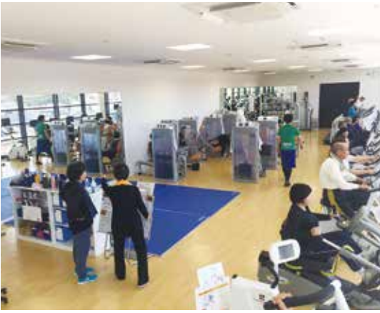
池の川さくらアリーナのトレーニングルーム

市内利用登録者の居住地は、さくらアリーナ周辺の本庁・多賀地区がおよそ56%であり、残りの44%は北部・南部地区の利用者であることが