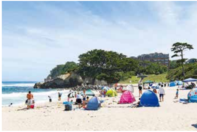
「快水浴場百選」に選ばれている伊師浜海水浴場

しむ機会の提供や、地元水産物の普及につながるかと考えるが、土地の確保や周辺環境への影響などの課題のほか、民間事業者の経営に関わる内容も含まれることから、今後、慎重に検討していく。 総合的な情報発信については、モニターを設置を含め、より効果的な方法について検討を進めていきたいと考えている。