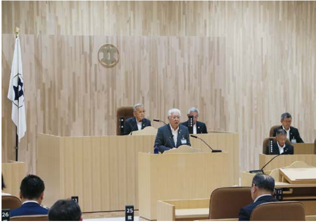
提出議案の説明を行う小川市長