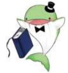
南部図書館キャラクター くじらちゃん