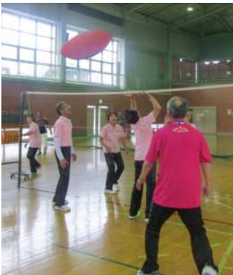
ヘルスバレーボールの競技の様子