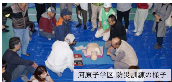
河原子学区 防災訓練の様子

東日本大震災のような大規模な災害が発生すると、通信手段が断たれ、交通機関が混乱し、市や消防、警察が直ちに全ての現場に向かうことができなくなります。そのような場合、ご近所同士で情報を共有しながら、お互いに助け合うことがとても重要になります。地域で行われる防災訓練に積極的に参加して、防災への意識を高め、災害に強いまちをつくりましょう。