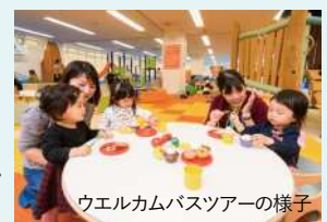
ウェルカムバスツアーの様子

ツアーでは毎回、市内にある親子にお勧めの観光スポットや、遊び場所を巡ります。昨年11月に開催されたツアーでは、「子どもセンター」、「ハレニコ!」「シーバズカフェ」の3か所を巡りました。主催する日立市シティプロモーション推進課は、「ハレニコ!は、室内施設なので雨天でも使えるのがいいですね」と話しています。天気は左右されず利用できるのは、うれしいですね。