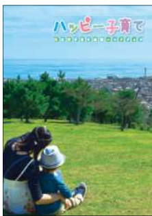
*現在のハンドブックの表紙

申し込み 2月12日(水)から18日(火)までに、「子育て応援ハンドブック広告掲載申込書」(市のホームページからダウンロードできます)を直接か郵送で、広報戦略課 内線293へ *後日、掲載の可否を通知します。広告の原稿は、通知後に提出してください。