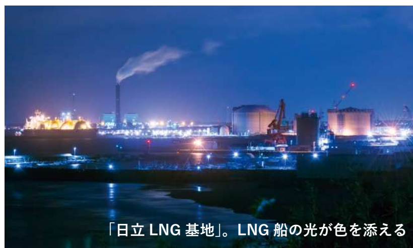
「日立 LNG 基地」。LNG 船の光が色を添える