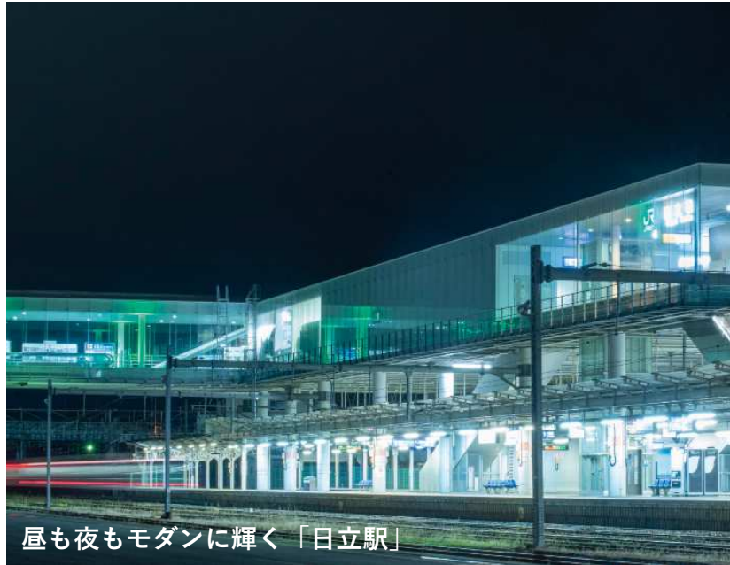
昼も夜もモダンに輝く「日立駅」