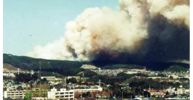
平成3年3月7日の林野火災の様子

大規模火災となり、住宅など20棟、車両30台、山林217.7ヘクタールを焼失するという大きな被害をもたらしました。この火災を教訓として、消防本部では、消火技術の向上と関係機関との連携を図るとともに、広く市民に防火・防災意識の高揚を図ることを目的として林野火災消防演習や広報を実施しています。