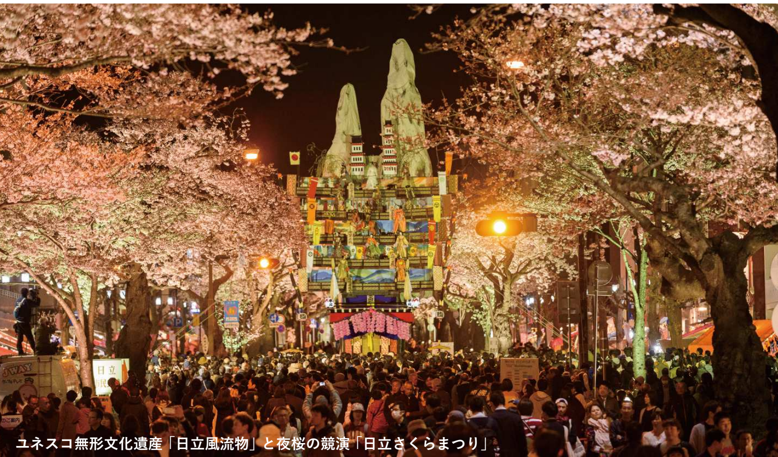
ユネスコ無形文化遺産「日立風流物」と夜桜の競演「日立さくらまつり」