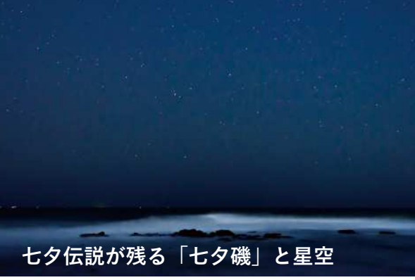
七夕伝説が残る「七夕磯」と星空