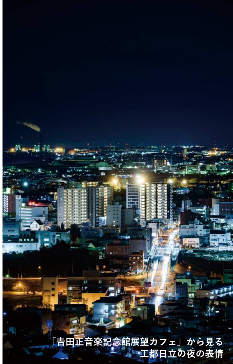
「吉田正音楽記念館展望カフェ」から見る 工都日立の夜の表情