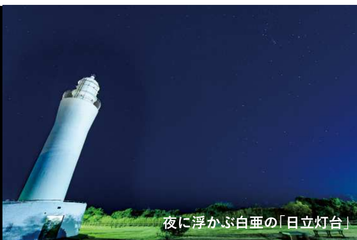
夜に浮かぶ白亜の「日立灯台」