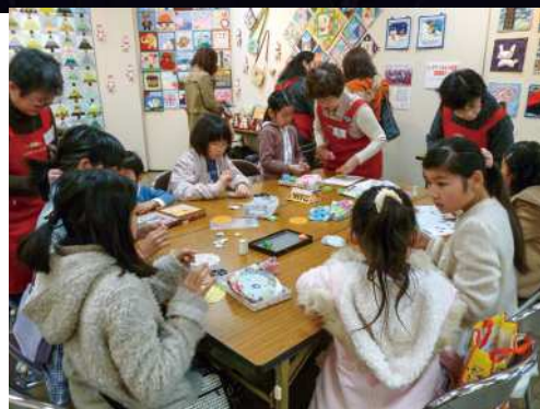
昨年のひたちこども芸術祭の様子