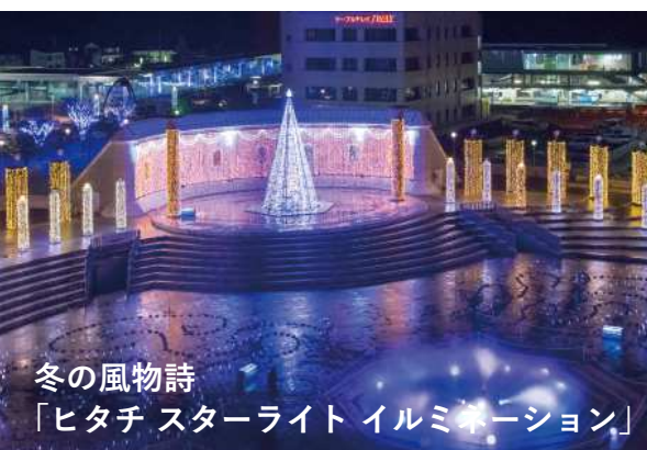
冬の風物詩 「ヒタチ スターライト イルミネーション」