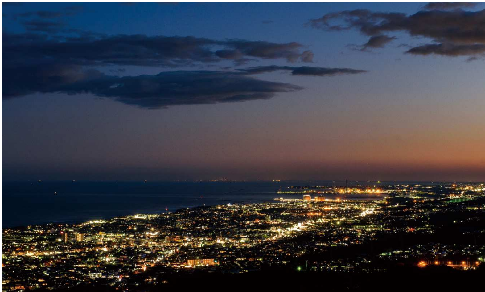
「助川山市民の森 頂上展望台」からは、 日立の夜景に加え、南は鹿島灘までを一望できる