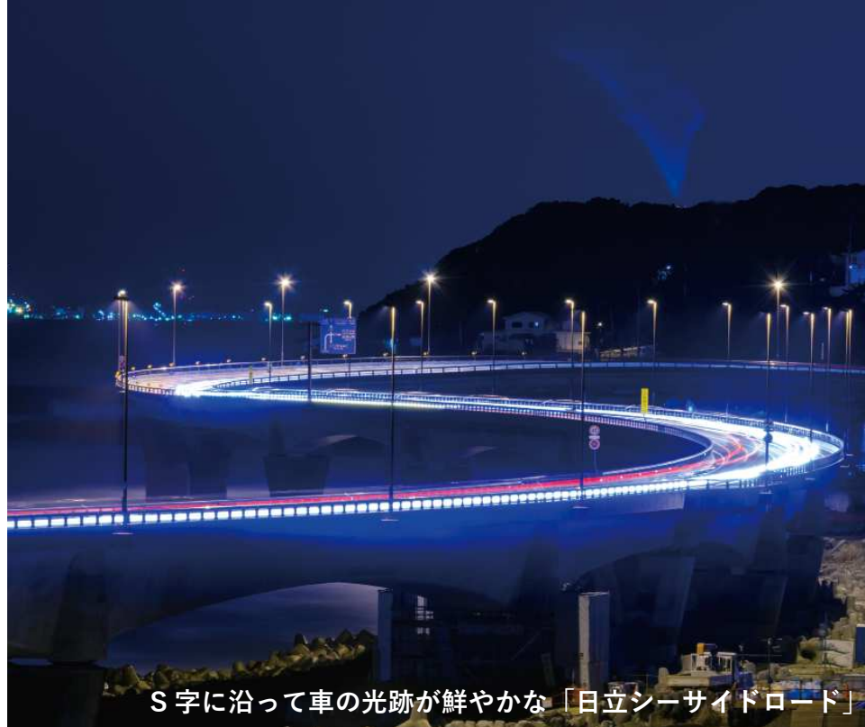
S字に沿って車の光跡が鮮やかな「日立シーサイドロード」