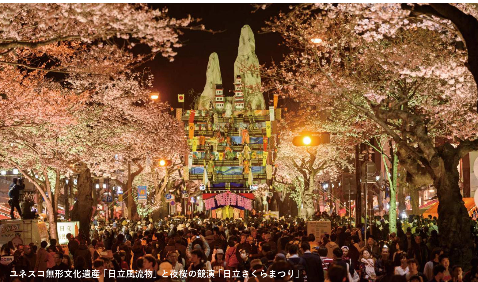
ユネスコ無形文化遺産「日立風流物」と夜桜の競演「日立さくらまつり」