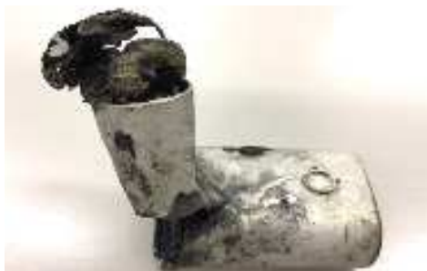
発火した加熱式たばこ

近年、スマートフォンやパソコン、加熱式たばこなどリチウムイオン電池を内蔵した製品が増えており、ごみを処理する過程でリチウムイオン電池などが発火・発煙するトラブルが全国的に増えています。家庭からごみとして捨てられるモバイルバッテリーや加熱式たばこ本体などが燃えるごみに混入することで、ごみ収集車の中で圧縮されて発火・発煙するケースも増えています。