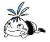
十王図書館キャラクター テンちゃん