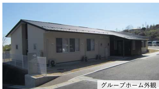
グループホーム外観

問合せ 障害福祉課 内線 492、鳩が丘さくら福祉センター多用途ホール TEL 87-8270、鳩が丘さくら福祉センターグループホーム TEL 24-5402