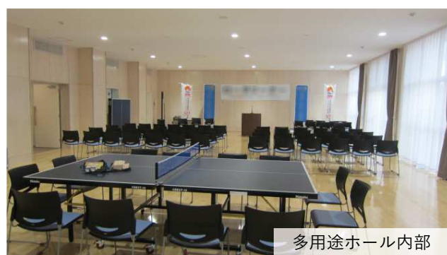
多用途ホール内部