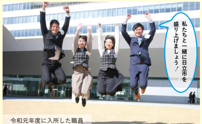
令和元年度に入所した職員

受験方法や試験内容はもちろん、職員のインタビューも盛りだくさん！受験を考えている方、悩んでいる方、必見です！！