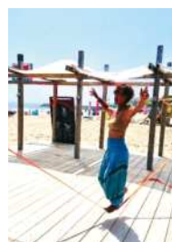
◀「アートビーチくじはま」でのスラックライン体験

市民教授の講座で「学びたい」方は、ひたち生き生き百年塾のホームページをご覧ください。