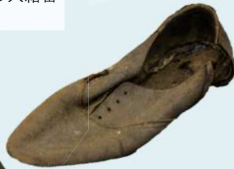
写真左：兵用外套 写真右：軍靴 (有馬義明さん寄贈) どちらも、硫黄島で戦死した有馬元明さんの遺品で、平成27年の遺骨収集活動の際に発見されたもの。有馬さんは大子町出身で、日立市内で反物の行商をしていた。