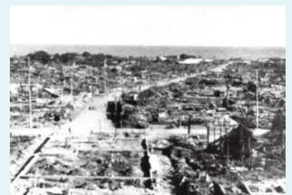
焼野原になった市街地

また、焼夷弾攻撃は、日立から北上する形で行われ、小木津、川尻、伊師浜、伊師町、磯原、高萩の順に投弾されました。