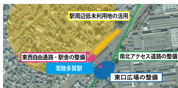
短期的・重点的に実施する施設整備の方針