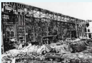
破壊された日製多賀工場

また、櫛形村（現十王町）においては、7月17日午後11時過ぎ、高萩沖海岸からの艦砲射撃を受け、村内に着弾、死傷者が出ました。