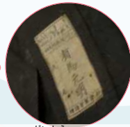
兵用外套の前身頃の内側には、氏名と軍の入籍番号の記載がある。

今を生きる子どもたちの世代が平和に暮らせるよう、平和のバトンを繋いでいくため、私たちが今何をすべきか、一緒に考えてみませんか。 問合せ 文化・国際課 内線595