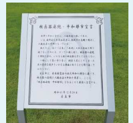
市役所敷地内に設置した平和啓発看板

日立市は、核兵器の廃絶と人類永久の平和を願って、昭和60年12月24日に「核兵器廃絶・平和都市宣言」をしました。このたび、平和への願いを次世代に伝えていくため、市役所敷地内（レストラン向かい）に「核兵器廃絶・平和都市宣言」の啓発看板を設置しました。これは、日立シビックセンター新都市広場と常陸多賀駅ロータリーに設置している看板と同じものです。ぜひご覧いただき、平和について、思いを馳せてみてください。