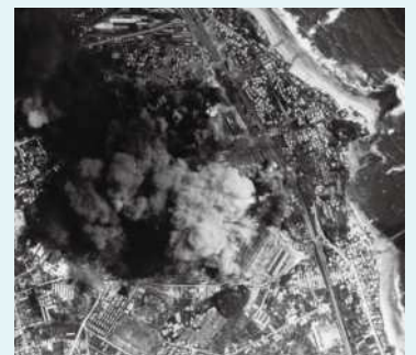
爆撃の様子

日立製作所日立工場（海岸工場）に向けて、100機を超える米軍機B29から1トン爆弾の攻撃を受けました。508発（米軍記録では806発）もの1トン爆弾は、日立工場（海岸工場）と工場周辺の相賀町などに投下され、従業員と一般市民合わせて886人が亡くなりました。