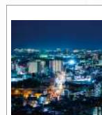
吉田正音楽記念館展望カフェからの夜景