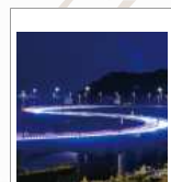
日立シーサイドロード