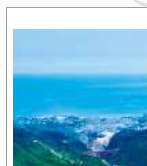
神峰山から見た大煙突