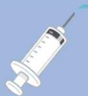
インフルエンザ 予防接種