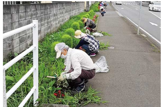
問合せ コミュニティ推進課 内線 488