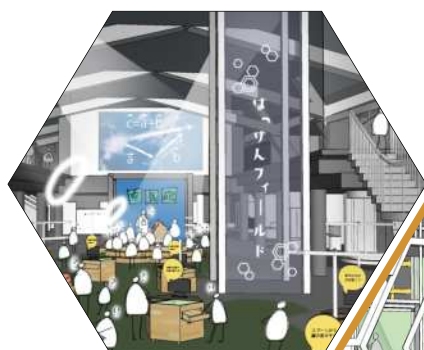
サイエンススタジオのイメージ

リズム、響きなどの語感が優れており、正式名称である「日立シビックセンター科学館」のみでは表現しきれない要素を多く持っている。