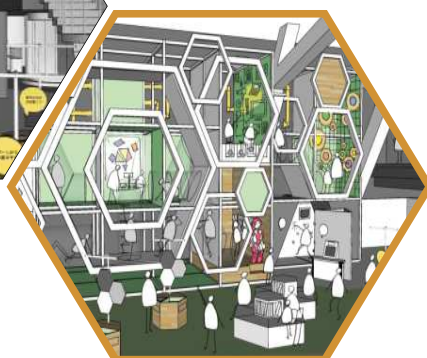
シンボル展示のイメージ