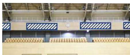
池の川さくらアリーナ(東側)