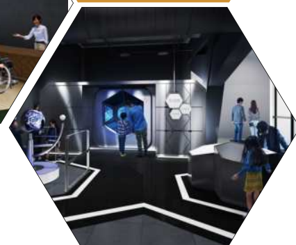
たんきゅうガレージのイメージ