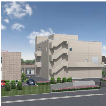
電気棟外観イメージ

伊師浄化センターに、津波対策として電気棟を建設します 工事中、来場者にご迷惑をおかけしますが、ご協力をお願いします。 詳細は、日立・高萩広域下水道組合ホームページでお知らせします。 建設期間 3月～来年3月(予定) 日立・高萩広域下水道組合伊師浄化センター 日立・高萩広域下水道組合施設管理課 TEL 39-5597