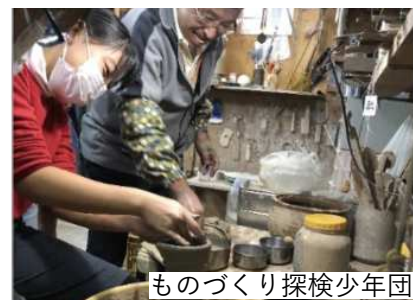
ものづくり探検少年団