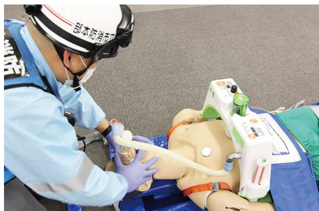
人工呼吸も行うことができ、一つの機器で一連の心肺蘇生法を実現し、救命率の向上を目指します