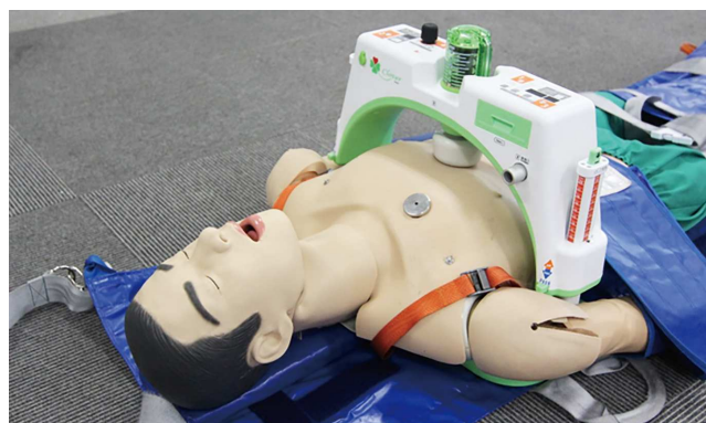
心肺停止傷病者の身体に合わせて、質の高い胸骨圧迫を継続して行います

更なる救命率向上のため、一刻を争う現場活動においても、新たな資器材を活用し、感染対策を万全にして、市民の皆さんの安心、安全に応えられるよう努めてまいります。