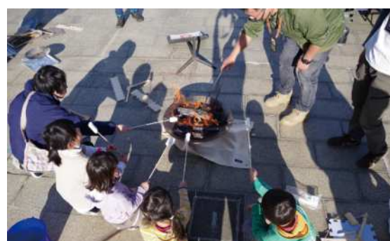
令和2年度開催イベント 「HOW TO アウトドア 火起こし・焚き火講座」の様子

*随時募集しています。申し込み方法など、詳しくは市のホームページをご覧ください。