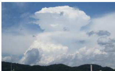
市内で発生した積乱雲

積乱雲は、地面付近の暖かい空気と上空の冷たい空気との温度差が大きくなった「大気の状態が非常に不安定」の時に起こる強い上昇気流によって発生し、危ない雲と言われています。