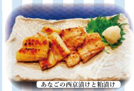
あなごの西京漬けと粕漬け