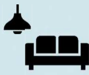
インテリア コーディネーター