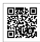
申し込みはこちら

な)、学校名、学年、電話番号、メールアドレス、保護者氏名を茨城大学工学部技術部のホームページから申し込みを。 間 茨城大学工学部 TEL 38-5084 申 申し込みはこちら 健康 オンライン市民公開講座 「切らずに治すがん治療」 時 7月31日(土) 午後2時～3時