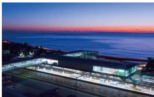
左：夜明け前の日立駅。建築と自然の調和。美しい建築に朝日と海が彩りを加える。

私たちは、日立駅を訪れるたび、自由で奥深い空間とそこに生まれる美しい光景に出会うことができる。