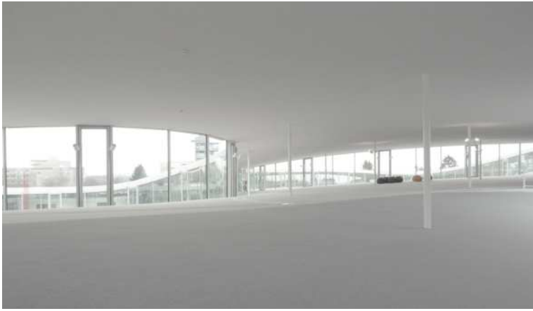
+ ROLEX Learning Center / ROLEX ラーニングセンター photo by SANAA スイス連邦工科大学ローザンヌ校キャンパス内に建設された、学習施設