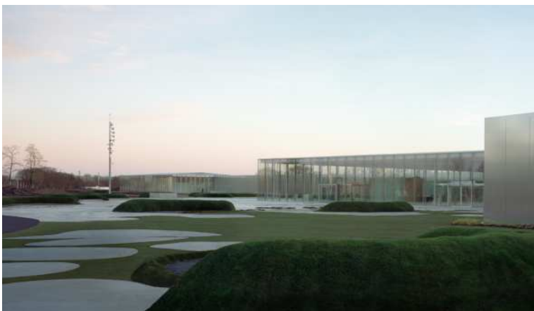
FR Louvre-Lens / ルーヴル・ランス フランスのランスに建設された、ルーヴル美術館の別館

妹島和世さんと西沢立衛さん主宰の設計事務所「SANAA」 そのSANAAが手掛けた、世界中の美しい建築をご紹介します