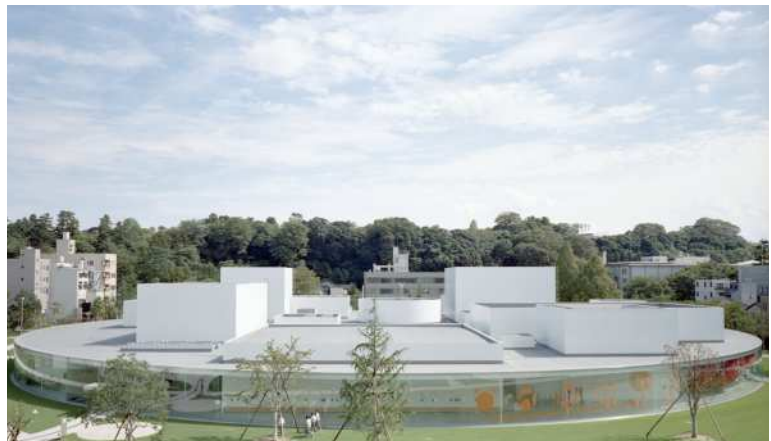
JP 金沢 21 世紀美術館 photo by SANAA 石川県・金沢市に建設された、現代美術を収蔵する公立美術館