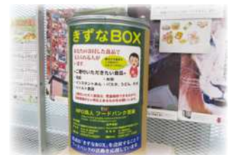
きずなBOX（食品収集箱）