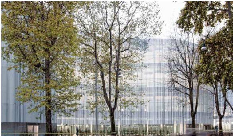
IT Bocconi University New Urban Campus / ボッコニ大学新キャンパス photo by SANAA イタリア・ミラノに建設された、伝統ある私大の新しいキャンパス