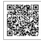
申し込みはこちら

内 講義「がんの放射線治療と陽子線治療」と質疑応答 講師 櫻井英幸さん(筑波大学附属病院放射線腫瘍科教授) *オンライン(Zoom)で開催 申 7月27日(火)までに、左記QRか、メールで、筑波大学附属病院 総合がん診療センター メール ccc@utsukuba.ac.jpへ *申し込み締切後に詳細をメールで連絡します。