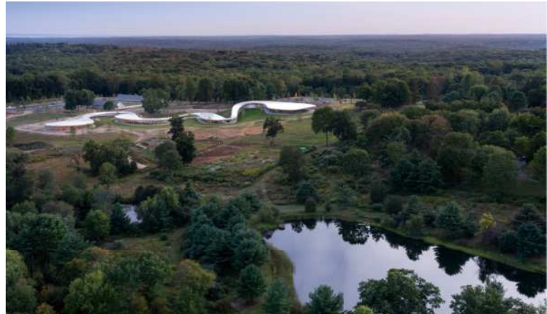
USA Grace Farms / グレイス・ファームズ アメリカ・コネチカット州に建設された、民営のコミュニティセンター