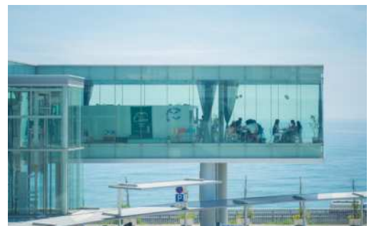
右：まるで海に浮かんでいるかのようなシーバズカフェ。7ページに掲載している10周年を記念した特別メニューをお楽しみに。