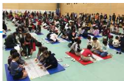
ひたち郷土かるた大会 ▶