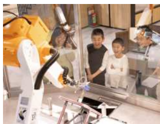
ロボット画伯アートン