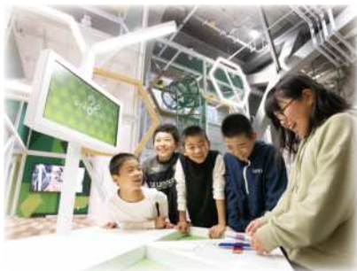
「はてなコンテナ」では楽しい実験を体験できます

と思いますが、科学館に来たことをきっかけに、科学は難しいものではなくて、身の回りにあふれているということに気づいてもらい、興味をもってもらえると思います。楽しいと感じてもらえるような展示や実験ショーを今後も行っていきたいと思っています。夏休みに向けてイベントなども企画していますので、ぜひ遊びにきてください。