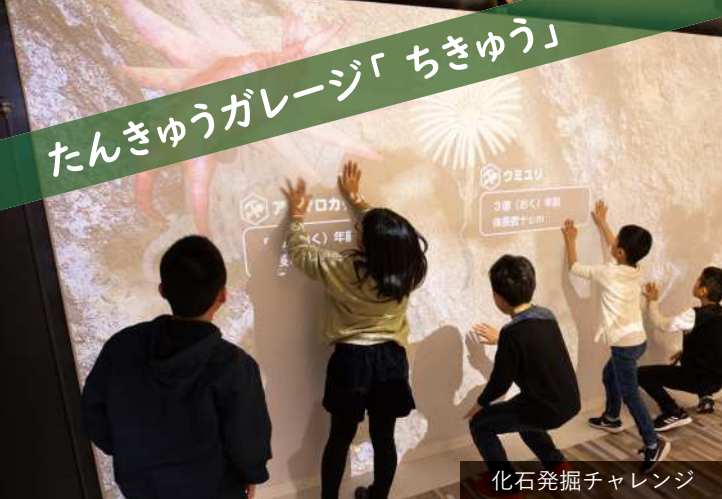
化石発掘チャレンジ