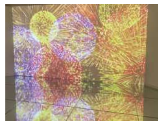
カレイドシアター

新しくなった科学館「サクリエ」には、ここで紹介できなかった展示物がまだまだたくさんあります。