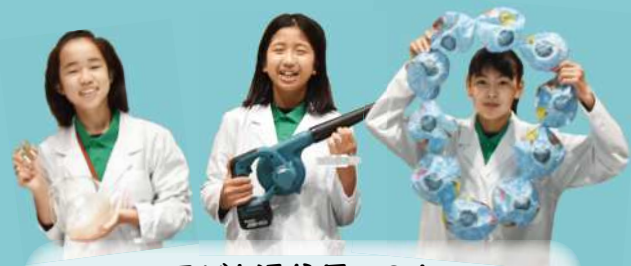
子ども通信員の3人