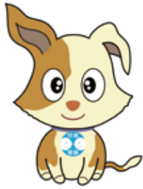
総務省行政相談センター