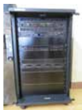
助成金で整備した音響機器

この宝くじの社会貢献広報事業は、自治総合センターが宝くじの受託事業収入を財源として、コミュニティ活動に直接必要な設備などの整備にかかる経費を助成しているものです。