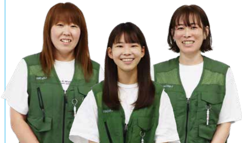
大久保学区内で防災少年団として活動している皆さん。「災害を正しく恐れる」ため、3人で防災士の資格を取得しました。(中央の方は市内で唯一の10代(高校生)の防災士です。)

防災活動や地域防災力の向上のために、十分な防災意識と一定の知識・技能を備えた方が取得できる「防災士」の資格。市内では172人(令和4年6月現在)が取得しています。今回は、防災士として市内で「防災少年団」の活動をしている皆さんをご紹介します。