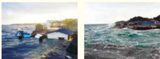
←東日本大震災の津波の様子