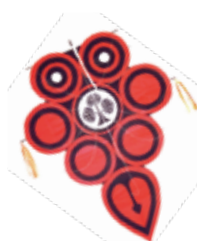
家紋は風の中心に配置します。家紋以外のマークでも可。

申 11月28日(月)までに下記QRからか、電話で教育研究所 ☎内線682へ*平日午前10時〜午後4時 場 教育プラザ 対 小学3年生以上 *小学生は保護者同伴。先着15組(1組3人まで)。1組1つ作成 内 市の南部に伝わる「八つ風」を作ります。講師〓八つ風保存会会員 持ち物〓はさみ、30cmの定規、昼食、自分の家の家紋または好きなマーク(直径16〜20cm) 料 1組2000円(材料費) 申 11月29日(火)の午前9時から電話で、郷土博物館 ☎23-3231へ