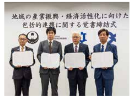
日立市役所で覚書を締結（11月1日）

多様な産業政策手法とネットワーク（専門家、支援機関など）を有する関東経済産業局と、地域課題や地域企業を熟知する自治体が連携・協力することで、デジタル化や脱炭素など社会経済の変化に対応した支援や、新たなテクノロジーの活用など市単独ではこれまで着手しづらかった取組の推進が期待されます。