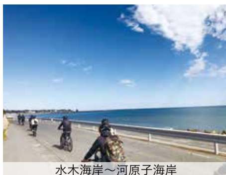
水木海岸～河原子海岸