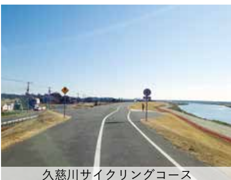
久慈川サイクリングコース