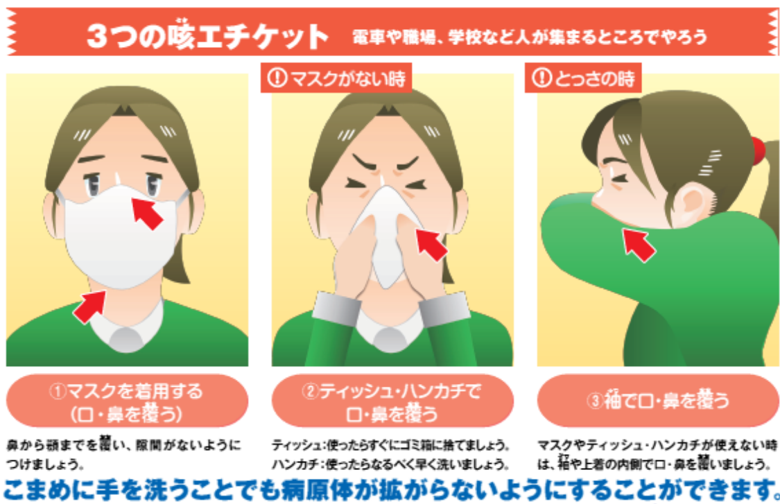
図3 咳エチケットについて