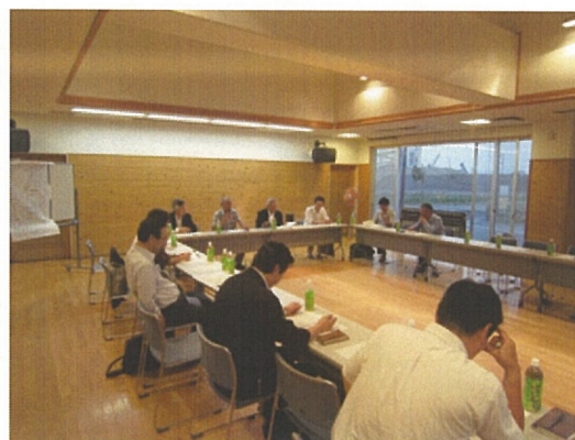
(仮称) 新交通利用促進会議の開催風景

この地域応援組織は、新交通利用促進会議という仮の名前で発足され、これから、会の名称や今後の活動内容を会員自ら企画し、実行していきます。