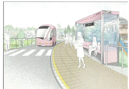
新交通導入のイメージ（久慈町）