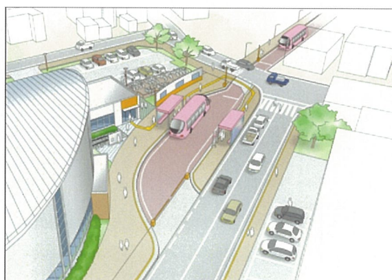
新交通導入イメージ図（旧久慈浜駅）